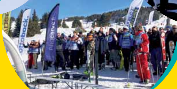
Ski dans les Alpes