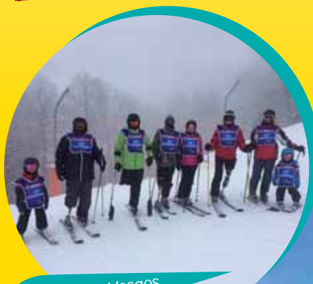
Ski dans les Vosges