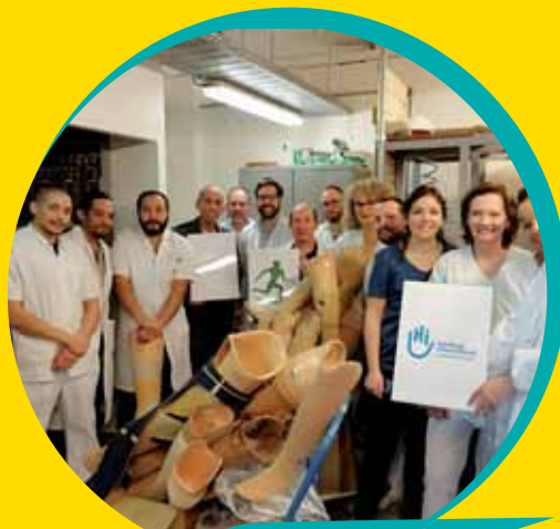
Dons de prothèses