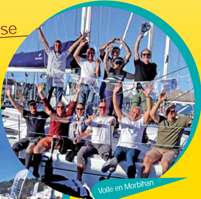
Voile en Morbihan